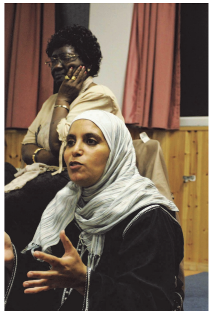
Dialogo in de moskee

Het bleek niet mogelijk om samen met de moskeebesturen tot een programma te komen dat voor zowel christenen als moslims verder gaat. De moskeebesturen zijn vriendelijk, maar erg met hun eigen zaken bezig. Voor dit seizoen is besloten de voorlichting over de islam alleen op verzoek van maatschappelijke organisaties te verzorgen.