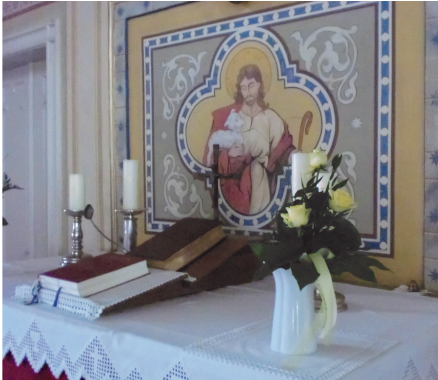
Lezingen als onderdeel van de liturgie

In 2019 wordt vijftig jaar liturgiehervorming in de Romana gevierd, met de vruchten die de oecumene daarvan ge- plukt heeft: de Bijbelse verbreding van de ABC- cycli. Voor dat jaar zijn wij terughoudend geweest met het aan- dragen van alternatieve lezingen, om de brede kerkelijke waardering voor het Lectionarium '69 te onderstrepen.