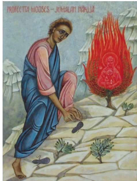
Orthodox icoon: Mozes bij het brandende braambos