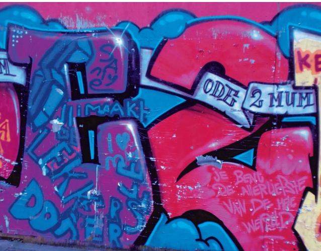
Taal verradt onderliggend gevoel

Uit de statische gegevens van de politie is bekend dat er in Nederland jaarlijks ook talloze vormen van agressie zijn tegen homoseksuelen, waarbij hun geaardheid aanleiding is voor het geweld. Reden voor de lidkerken van de Raad van Kerken om, alweer twee jaar geleden, in de lijn van de decade Geweld niet Gewild een verklaring te ondertekenen tegen dergelijk geweld.