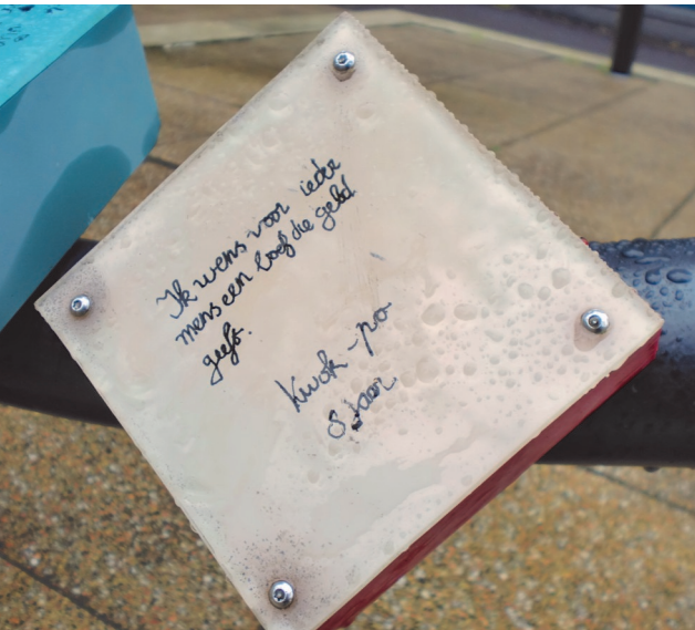
Kinderen schreven hun wensen uit op het 'wensplein voor vrede' in Amsterdam-Oost

Op de morgen van de derde dinsdag van september wordt in de Haagse Grote Kerk de Prinsjesdagviering gehouden. Deze bijeenkomst is bedoeld om de leden van de Staten-Generaal en de regering een moment van bezinning te geven bij het begin van het parlementaire jaar. Vertegenwoordigers van religieuze en levensbeschouwelijke groepen en maatschappelijke organisaties, maar ook een breed publiek van ouderen en jongeren zijn hierbij welkom.